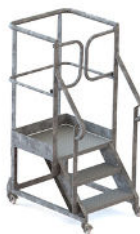
GARDE CORPS TOTAL AVEC PORTILLON