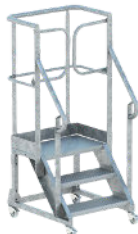
PALIER 400 X 680 MM