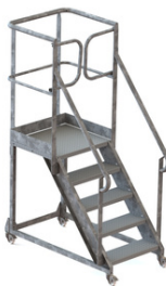
5 MARCHES H 1000mm