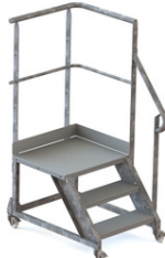
GARDE CORPS PARTIEL DROITE