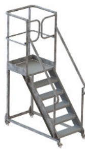
6 MARCHES H 1200mm