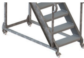
4 ROUES Mobilité +