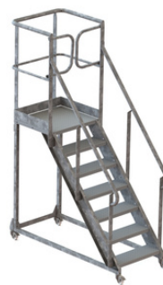
7 MARCHES H 1400mm