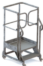
2 MARCHES H 400mm