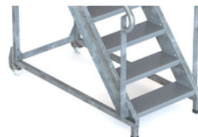
2 ROUES ET 2 PIEDS Stabilité +