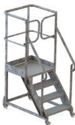
4 MARCHES H 800mm