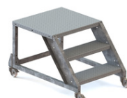
SANS GARDE CORPS