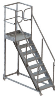
8 MARCHES H 1600mm