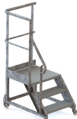
GARDE CORPS PARTIEL GAUCHE