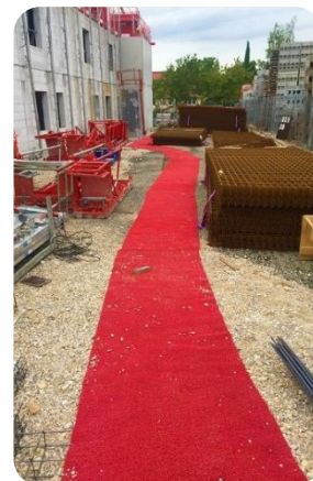
Tapis spaghetti sol souple (boue, sable gravier...) Épaisseur: 12 mm Largeur: 1000mm Rouleau: 10m