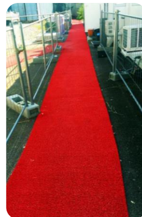
Tapis spaghetti intermédiaire (Emploi polyvalent) Épaisseur: 9 mm Largeur: 850mm Rouleau: 12m