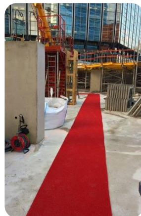
Tapis spaghetti sol dur (béton, carrelage, bois...) Épaisseur: 4 mm Largeur: 1000mm Rouleau: 10m