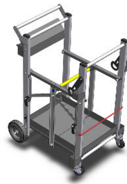
CHARIOT DU FINISSEUR SANS AUGE Réf. : NC00240