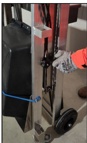
2 Desserrer les poignées de blocage