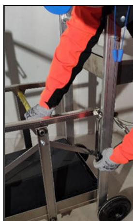
4 Serrer les poignées de blocage