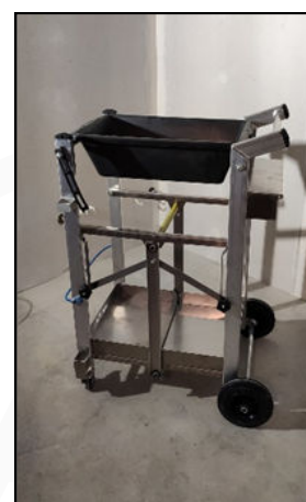
5 Prêt pour utilisation