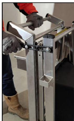
1 Libérer les attaches caoutchouc