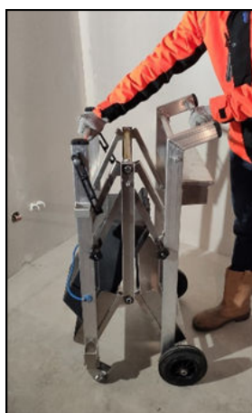
3 Déplier le chariot