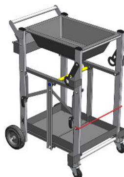
CHARIOT DU FINISSEUR AVEC AUGE Réf. : NC00230