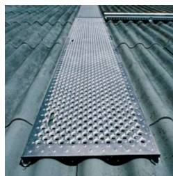
2 profils Poids 15kg