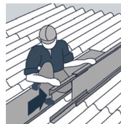
4 éclisses de raccordement