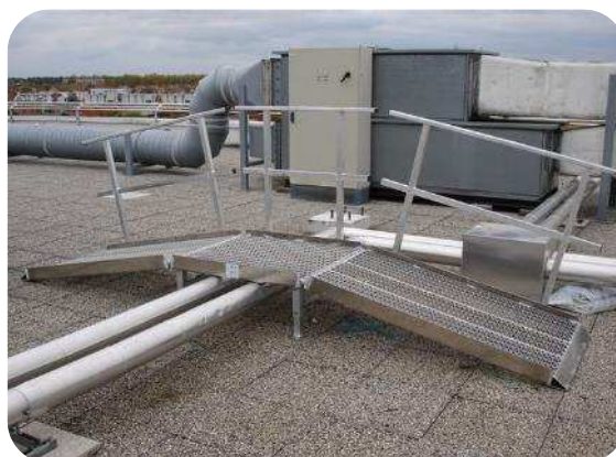
Rampe d'accès avec 1 garde corps pour transport matériels au dessous de conduit