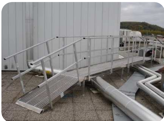
Rampe d'accès avec garde corps gauche et droit