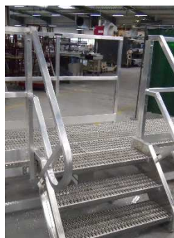
PLATEFORME DE TRAVAIL