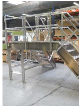
ESCALIER QUART TOURNANT