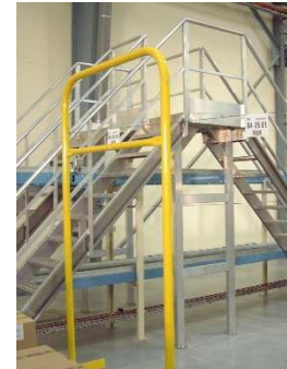
ESCALIER CONVOYEUR TRIPLE ACCÈS