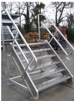
ESCALIER GRANDE LARGEUR