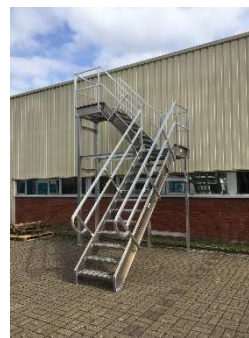
ESCALIER DOUBLE VOLEE