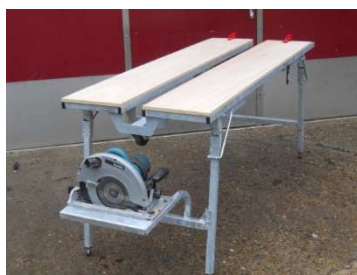
Table de sciage à évidement centrale Effectuez vos travaux de sciage sur une zone centrale de découpe Ref NT00104