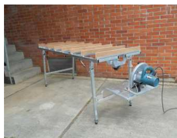
Table de sciage multicoupe Découpez vos matériaux sur toute la surface de la table grâce au bois perdu Ref NT00109

Table de sciage à évidement centrale Effectuez vos travaux de sciage sur une zone centrale de découpe Ref NT00104