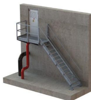
ACCÈS LATÉRAL POUR escalier parallèle au mur

Configurez vos échelles, escaliers et sauts de loup acier ! Obtenez votre devis détaillé et plan sur mesure en vous connectant sur www.anoxa.fr .