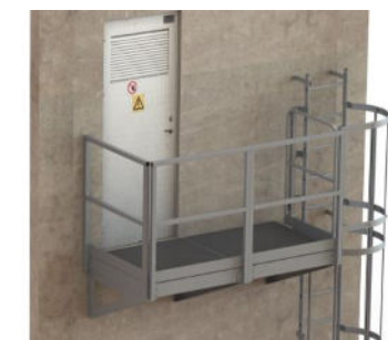
SORTIE LATÉRALE HAUTE d'échelle