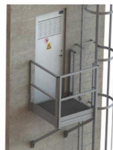
SORTIE LATÉRALE INTERMÉDIAIRE d'échelle