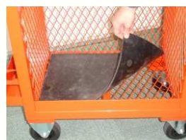
Tapis de protection